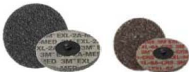
XL-DR diam. 75 mm