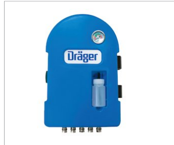
Filtro PAS® Dräger - portatile