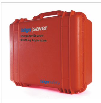
Armadietti di custodia